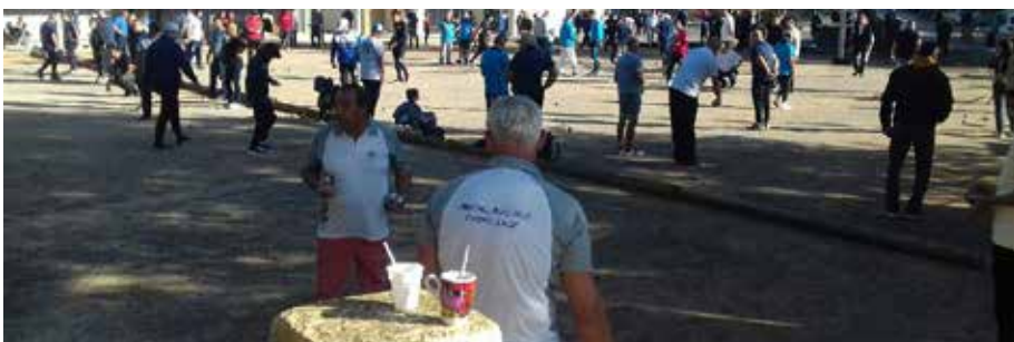
Semaine bouliste de la saint Sauveur organisée par la Boule Rocbaronnaise du 21 au 27 juillet 2020