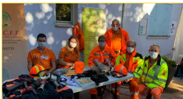
Le Comité Communal des Feux de Forêt (CCFF)