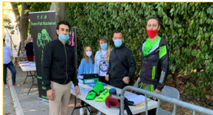
Le Team Full Rocbaron, club de boxe pieds poings