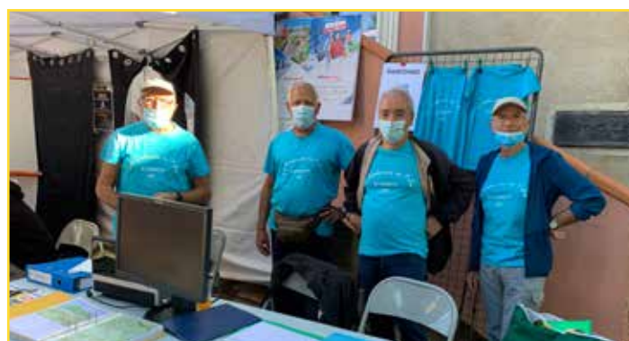
Les Godasses en folie