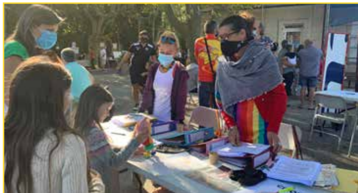
L'école de cirque Aqueou Canailles

Cette année le forum des associations a déménagé ! Suite à la crise sanitaire, la Place de la Mairie était préférable au gymnase Gassendi. L'ambiance était au beau fixe malgré le port du masque obligatoire. Une cinquantaine d'associations étaient présentes en cette belle journée !