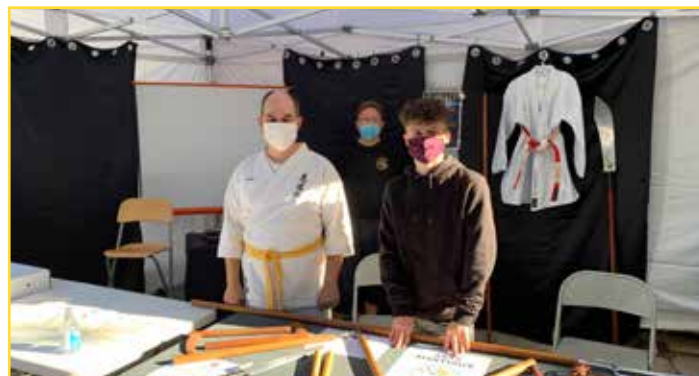
Le club de karaté Uchinadi