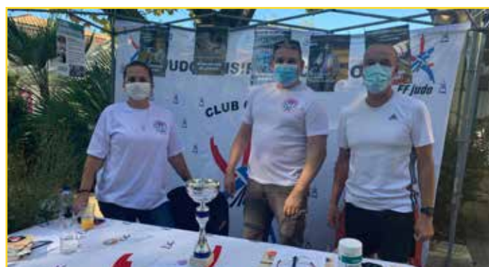
Le club de judo loisirs