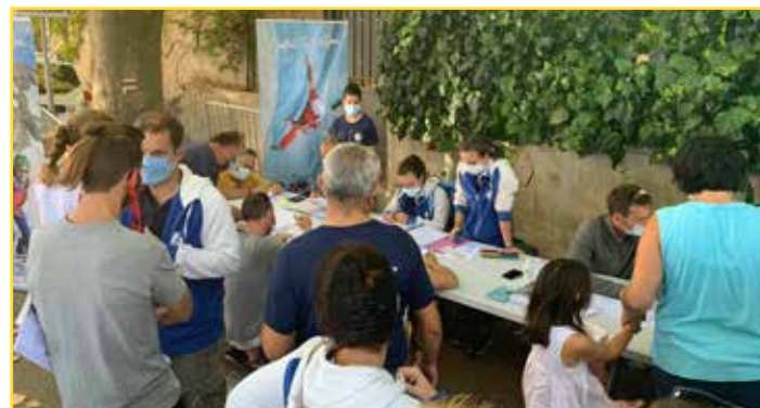
Le Club Alpin Français, escalade