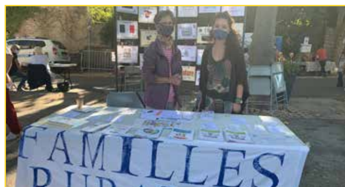
L'association Familles Rurales