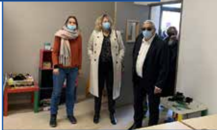
Des échanges positifs avec les élus communaux et les partenaires.