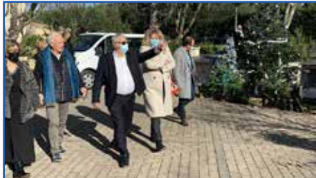
Un tour complet de la commune pour apprécier la qualité des nouvelles installations aux Clas et aux écoles

La Députée Valérie GOMEZ-BASSAC est venue à Rocbaron pour faire le point sur les dossiers en cours, constater l'achèvement de certains équipements et assurer son soutien pour les perspectives futures. Un retour en images sur un moment constructif.