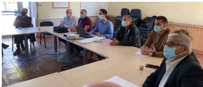
Les conseillers municipaux pourront poser toutes leurs questions à l'occasion du prochain conseil le 8 février.

En exploitation, la présence d'un poste électrique ne pollue ni le sol, ni les eaux.