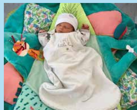
Aïden BOEUF né le 25 décembre 2020 à TOULON