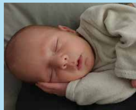
Tilio PASCAULT né le 30 novembre 2020 à Toulon