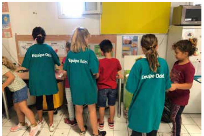
Les élèves ambassadeurs veillent à la bonne exécution du tri