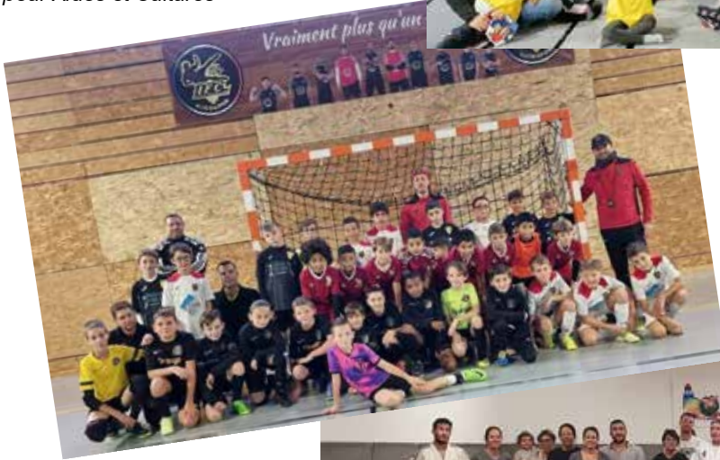
Tournoi de Noël pour l'Issole Futsal Club