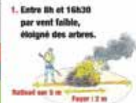
1. Entre 0h et 16h30 par vent faible, éloigné des arbres. Nettoyé sur 3 m. Payer 12 m.