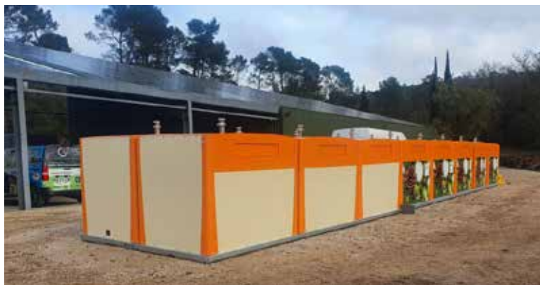
Les conteneurs seront répartis sur la Commune de manière concertée avec le SIVED NG

Cette nouvelle habitude de tri marque une étape supplémentaire dans la valorisation des déchets et permettra d'optimiser le remplissage des bacs jaunes, ainsi débarrassés de cartons encombrants.