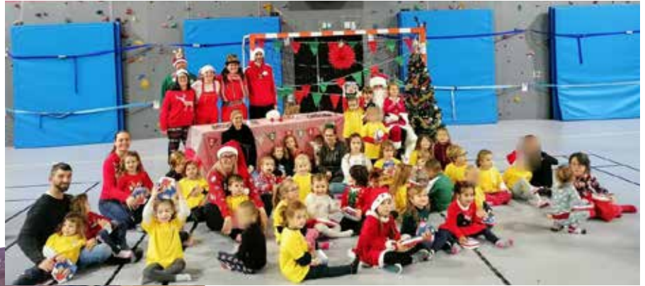
Distribution de cadeaux pour Roc'Gym section Baby gym et fit'hoop