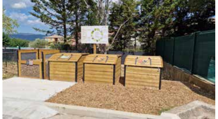
Les bacs, installés au plus près de la cantine, permettent un accès aisé pour les enfants et le personnel cantine

Saluons l'engagement des équipes éducatives et de la cantine, le travail du Service Technique, l'aide et l'expertise du SIVED 83 et bien entendu les enfants, premiers concernés par l'avenir de notre planète.