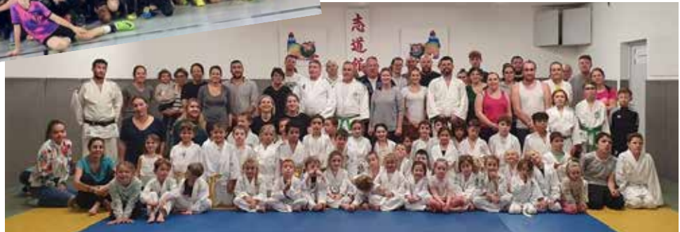
Entraînement parents-enfants pour le Club Judo Loisirs