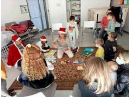
Séances de contes et ateliers manuels pour Aides et Cultures

La fin de l'année a été l'occasion pour les associations d'organiser des animations à destination de leurs adhérents et leurs familles.