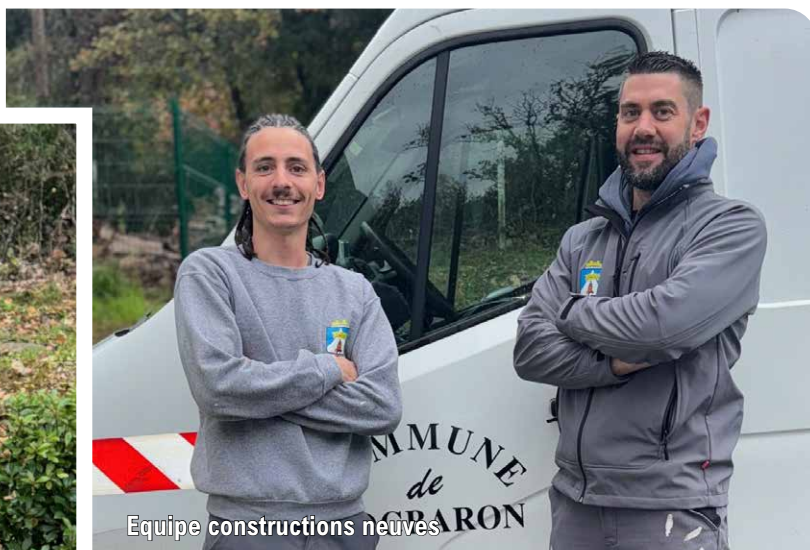
Equipe constructions neuves

Nous devons faire preuve d'une polyvalence importante. L'entretien du parc communal demande des compétences en électricité — avec les habilitations nécessaires — en plomberie, en pein-